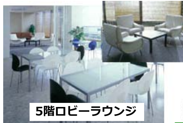
5階ロビーラウンジ