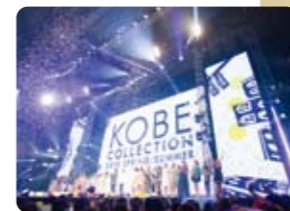
神戸コレクション ©神戸コレクション制作委員会

ファッションイベントや拠点施設を通じて全国に神戸アパレルを発信しています。アパレルの他にも、洋菓子や灘の酒など、衣・食・住・遊全般にわたる産業をファッション産業と位置づけ、人材の育成・交流、ビジネスマッチング、イベントの開催、情報発信等の事業を展開しています。また、市では、神戸の資源や魅力をデザインの視点で見つめなおし、くらしの豊かさを創造するための都市戦略「デザイン都市・神戸」を推進しています。平成20年10月16日には、これまでの取り組みと、これからの方向性が認められ、ユネスコ創造都市ネットワークのデザイン都市に認定されました。