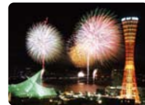
みなとこっぺ海上花火大会

神戸公式観光サイト 「Feel KOBE」も参照してください http://www.feel-kobe.jp/