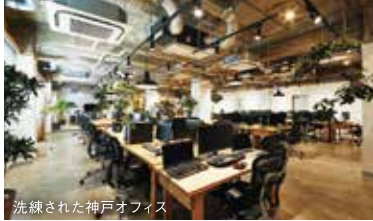
洗練された神戸オフィス